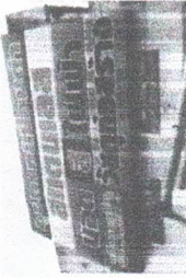
คำนวณหน่วยคำนวณ

ประเภทอัตราภาษี : ภาษาไทยล้วน ลักษณะป้าย : แบบคงที่/ไม่เปลี่ยนข้อความหรือภาพ